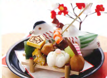
京都有職嶋台盛り