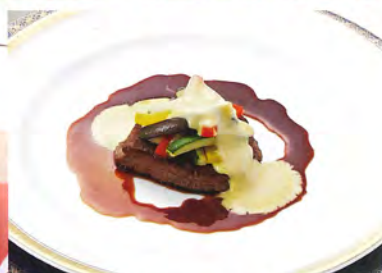
牛肉のポワレ プロヴァンス風

和食は現代風にアレンジした京都有職嶋台盛りと鯛茶漬けを、洋食は料理長こだわりの牛肉のポワレプロヴァンス風と季節のポタージュスープをご試食いただけます。