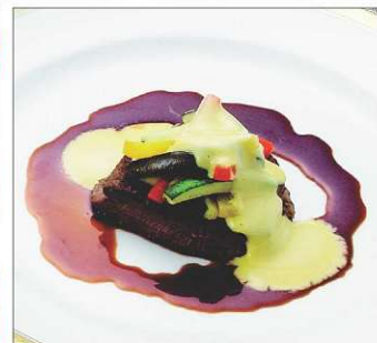
牛肉のポワレプロヴァンス風

現代風にアレンジした京都有職嶋台盛りと鯛茶漬、牛肉のポワレ プロヴァンス風と季節のポタージュスープをご試食いただけます。 和食・洋食とも料理長こだわりの料理をご用意いたしております。