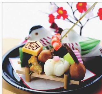
京都有職嶋台盛り