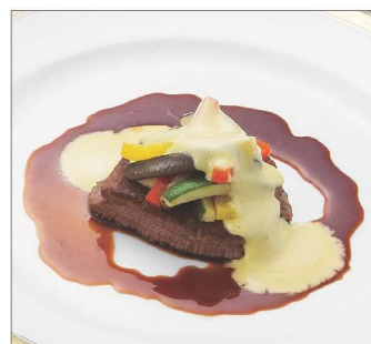
牛肉のポワレプロヴァンス風

現代風にアレンジした京都有職嶋台盛りと鯛茶漬、牛肉のポワレ プロヴァンス風と季節のポタージュスープをご試食いただけます。 和食・洋食とも料理長こだわりの料理をご用意いたしております。