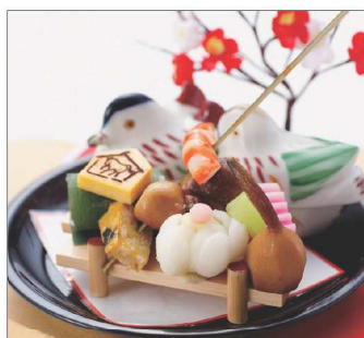
京都有職嶋台盛り